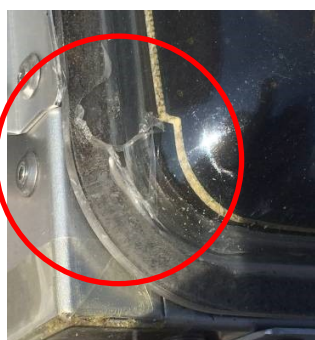
アクリルパネル割れ