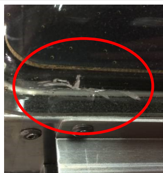
アクリルパネルにヒビ