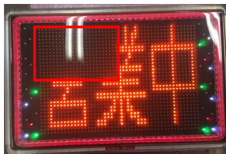
一部がブロックで不点灯