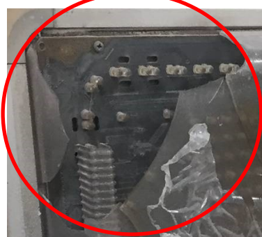
アクリルパネル割れ